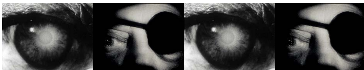
Samuel Beckett, Film (1965)

« L'image et son dehors : contours, transitions, transformations »